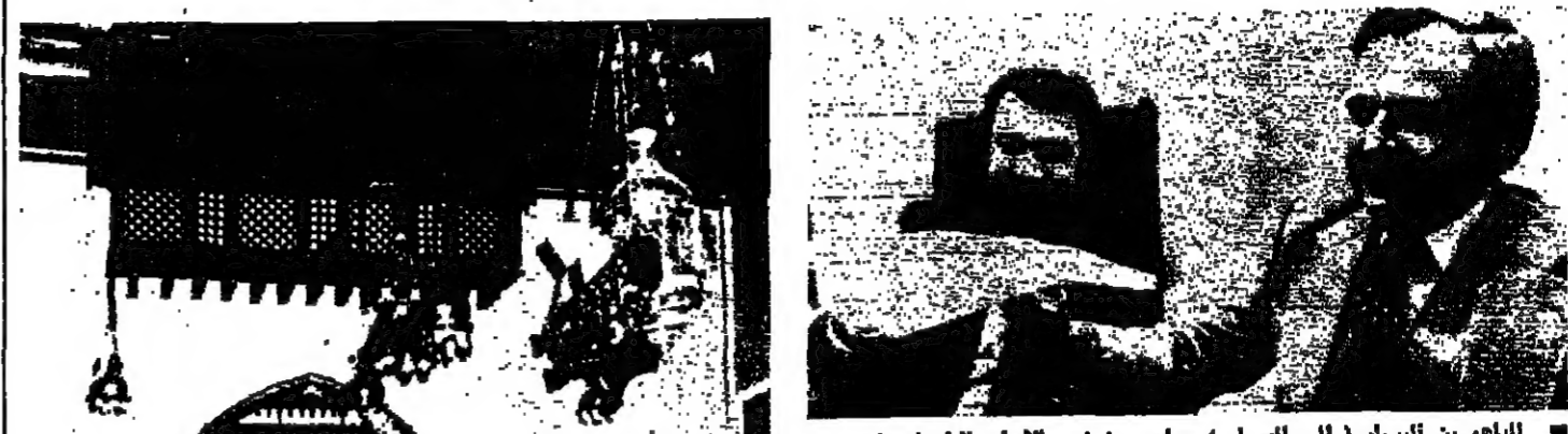
المهاجر بن اليسار ( الى اليسار ) وماير روزين ممثلا اسرائيل في مؤتمر القاهرة

في تحقيق اورده وكالة « رويترز » عن فندق مينا هانوس في القاهرة: قلت: سوف يكون هذا الفندق حيث كان زعماء الحلفاء يخطون استراتيجيتهم خلال الحرب العالمية الثانية ، مرة ثانية مكانة في التاريخ ولكن هذه المرة من الكراهية والمهانة . وعلى الرغم من ان مسؤولين مصريين يمتدحون سرا بان فندق هانوس هو مكان الاجتماع يوم ١٣ كانون الاول الحالي او حوالي ذلك التاريخ الا ان المكان لم يكتفِ زخما جندا . ومع ذلك فان « مينا هانوس » تفوق ان يكتفِ بخدماته بل يمتدحون بخدماته اي طيات حجب للاقامة كان مقرا ان اعتبارا من يوم ١ كانون الاول الحالي ، كسما ان عقدت جوارا كان مقرا ان يتسلطوا على فندق مينا هانوس مؤقتا ، كسر انه تلقى تعليمات مماثلة .